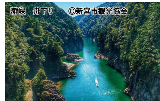
瀨峡 舟下り

友ヶ島は、地ノ島、虎島、神島、沖ノ島の4つの無人島群で構成されています。今回訪問する沖ノ島は加太港から定期船で20分の距離に位置し、要塞時代を偲ばせる砲台跡が点在。それらをめぐるハイキングコースも開かれています。純白の姿がコバルトブルーの海に見事に映える日本で8番目に建築された洋式灯台、第2砲台跡をはじめ、展望台、第3砲台跡、棧橋をめぐって自然と廃墟が融合した風光明媚な散策コースとしても人気があります。また、古い歴史をもつこの島は、役の行者に始まる修験道にまつわる史跡や行場も現存します。