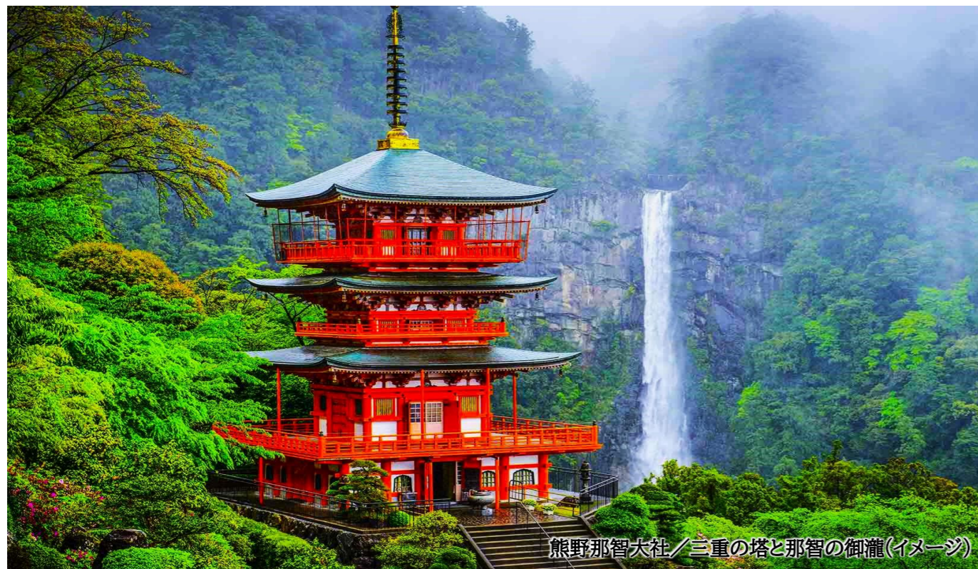
熊野那智大社／三重の塔と那智の御瀧(イメージ)