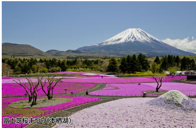
富士芝桜まつり(本栖湖)