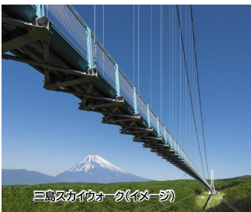
三島スカイウォーク(イメージ)