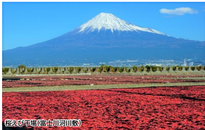
桜エビ干場(富士川河川敷)