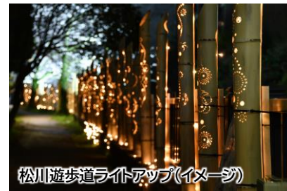
松川遊歩道ライトアップ(イメージ)