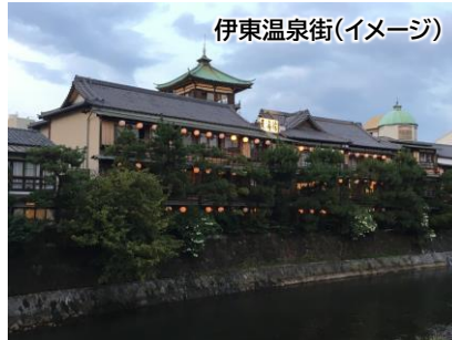
伊東温泉街(イメージ)