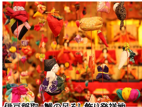
伊豆稲取 雛の吊るし飾り発祥地

静岡県の伊豆稲取温泉では毎年3月下旬まで「雛の吊るし飾りまつり」が開催されます。これは娘の健やかな成長や良縁を願い、手作りの吊るし雛を飾るという江戸時代から伝わる風習からはじまったお祭りです。期間中、稲取温泉周辺の会場では、鮮やかな布に身を纏った雛人形が、訪れた人の目を楽しませてくれます。雛壇の両脇に手作りの人形をつるす伝統文化は、伊豆稲取温泉ならではの光景です。当ツアーでは、稲取温泉に連泊いたします。