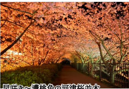
早咲き～濃桃色の河津桜並木

河津桜は2月上旬から3月上旬にかけて咲く早咲きの桜です。花は桃色や薄紅色で、ソメイヨシノより桃色が濃いです。花期が1ヶ月と長いことが特徴です。河津川沿い約4キロ続く桜並木で一足早い春の訪れを感じることができます。また、ライトアップされた夜桜もお楽しみください。