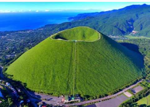
温泉だけじゃない！伊豆半島の見どころ

熱海、修善寺など昔ながらの温泉郷で有名な伊豆半島ですが、ペリー来航で知られる下田や、自然溢れる伊東などたくさん見どころがある地域です。当ツアーでは、ペリーロードと呼ばれて親まれる下田の昔ながらの街並みを散策したり、伊豆半島ジオパークに指定されているお椀型の大室山、そして大室山噴火の際にできた断崖絶壁の「城ヶ崎海岸」など伊豆半島の観光スポットを見落とすことなく巡ります。夜はもちろん温泉で疲れを癒してください。