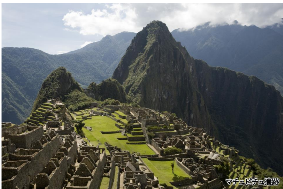
マチュピチュ遺跡

ご旅行期間とご旅行代金 [ご旅行代金には燃油サーチャージが含まれております。] 2023年10月19日(木)発~10月31日(火)着...¥799,000 お一人部屋利用追加料金 ¥83,000