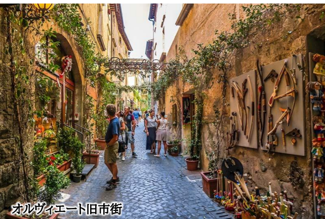
オルヴィエート旧市街