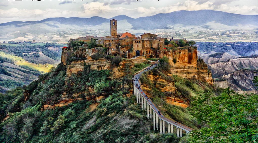
「天空の城」チヴィタ・ディ・パニョレージョ[イメージ]

ご旅行期間とご旅行代金 [旅行代金に燃油サーチャージが含まれております] 2023年 11月20日(月)発～11月27日(月)着…¥650,000 お一人部屋利用追加料金 ¥78,000