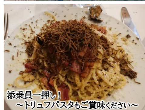
添乗員一押し! ～トリュフパスタもご賞味ください～