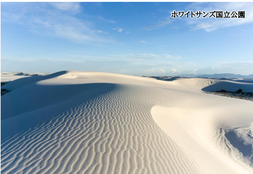
ホワイトサンズ国立公園