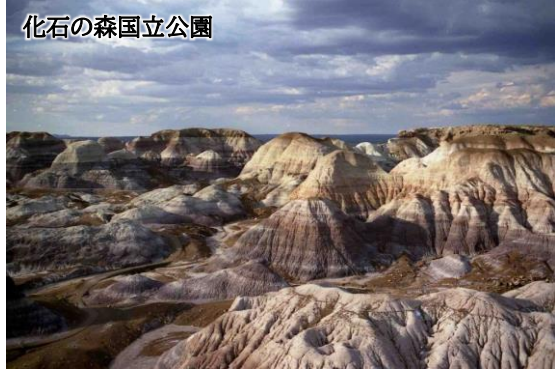
化石の森国立公園