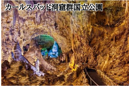
カールスバッド洞窟群国立公園

今からおよそ2億5000年前、地殻変動等により形成された洞窟群。かつてはアメリカ先住民達の避難場所として利用されていたといわれるこの洞窟に注目が集まったのは、19世紀以降コウモリの大群を発見し、肥料として重宝されていた鳥糞石を探ることがきっかけでした。後に鍾乳石で満たされたこの素晴らしい洞窟がアメリカ全土に知れ渡るようになると、ここは国立保護地区となりました。現在は国立公園となり、100以上の洞窟が発見され、世界遺産に指定されています。通常、訪問者は「ナチュラル・エントランス」と呼ばれる入り口から深く230メートル程のつづら坂を下り、「ビッグルーム」と呼ばれる世界最大級の部屋へと下ります。数十万年かけて形成された様々な鍾乳石群をゆっくりとご覧いただくと、そこから一気にエレベーターで地上階まで戻ることが出来ます。遊歩道もしっかりと整備されているので、安心してご見学いただけます。