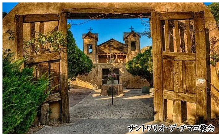
サントワリオ・デ・チマヨ教会