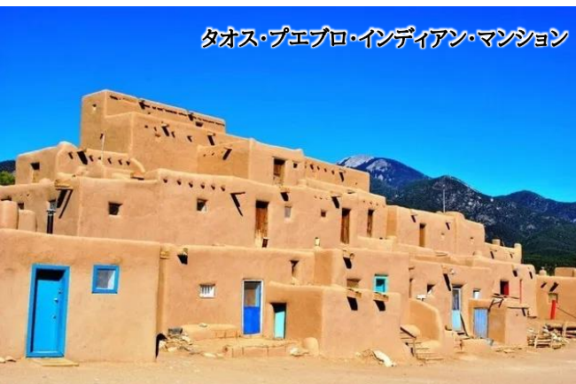
タオス・プエブロ・インディアン・マンション