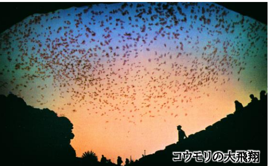
コウモリの大飛翔

アメリカには、55の国立公園と数え切れないほど多くの自然保護地域がありますが、今回はアメリカ西南部、世界でも非常に珍しい国立公園が集中するアリゾナ州とニューメキシコ州に注目しました。何万年もの時を経て形作られた素晴らしい鍾乳石が、地下空間を荘厳な大宮殿のように飾るカールスバッド国立公園、雪のように真っ白な砂丘が広がるホワイトサンズ、世界最大のサボテン・サワロが林立するサワロ国立公園、見渡す限りの原野に大量の木の化石が横たわる化石の森国立公園などをご紹介いたします。ネイティブ・アメリカンの聖地・サンタフェ周辺を連泊で巡ります。