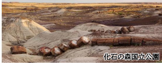
化石の森国立公園

アメリカには、55の国立公園と数え切れないほど多くの自然保護地域がありますが、今回はアメリカ西南部、世界でも非常に珍しい国立公園が集中するアリゾナ州とニューメキシコ州に注目しました。何万年もの時を経て形作られた素晴らしい鍾乳石が、地下空間を荘厳な大宮殿のように飾るカールスバッド国立公園、雪のように真っ白な砂丘が広がるホワイトサンズ、世界最大のサボテン・サワロが林立するサワロ国立公園、見渡す限りの原野に大量の木の化石が横たわる化石の森国立公園などをご紹介いたします。ネイティブ・アメリカンの聖地・サンタフェ周辺を連泊で巡ります。