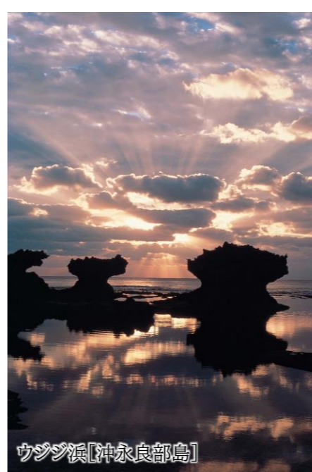
ウヅツ浜 [沖永良部島]

ケイビング[英語:caving]は 自然の洞窟・鍾乳洞を探検するアクティビティ を意味します。沖永良部島は大小200から300の洞窟・鍾乳洞があり、愛好家のあいだで 洞窟の聖地 といわれています。総延長日本第2位を誇る大山水鏡洞の一部で、ケイブパールや土器、化石などをはじめ色々な鍾乳石が見られます。 当ツアーでのコース内容はケイビング体験が初めての方でもご参加いただける最も簡単なコースです。洞窟の中をガイドと共に約2時間探検します。低い所をくぐったり、壁に手をつきながら歩くところもございます。また、腰より上まで水に浸かります。ヘルメット&ヘッドランプ、つなぎ、軍手、膝あては料金に含まれておりますが、中に着られる水着や汚れても良い靴はご準備ください。洞窟内ではガイドが写真撮影を行います。写真のデータはツアー終了後、添乗員からお配りします。