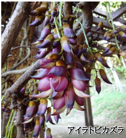
アイラトピカズラ