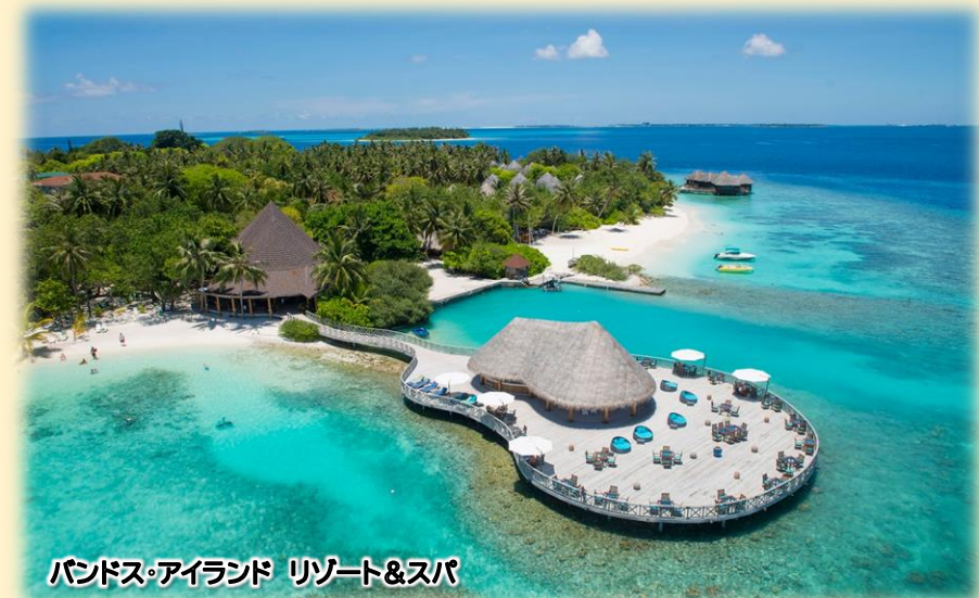
バンドス・アイランド リゾート&スパ

【お部屋の設備 [スタンダードルーム]】 シャワー・ビデのみ、金庫、目覚まし時計、ヘアドライヤー、バスローブ、タオル、ボディソープ、コンディショナー、シャンプー、ミニバー、コーヒーマーカー、電子レンジ、冷蔵庫、ボトル入り飲料水、薄型テレビ