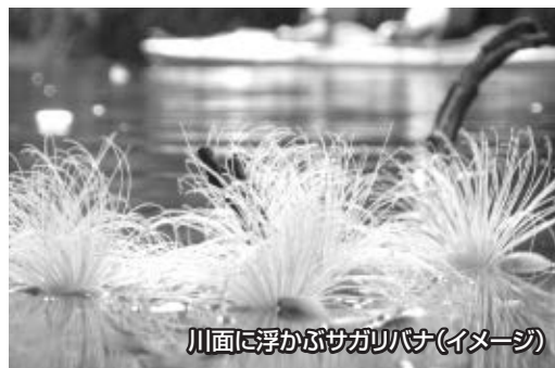
川面に浮かぶサガリバナ(イメージ)