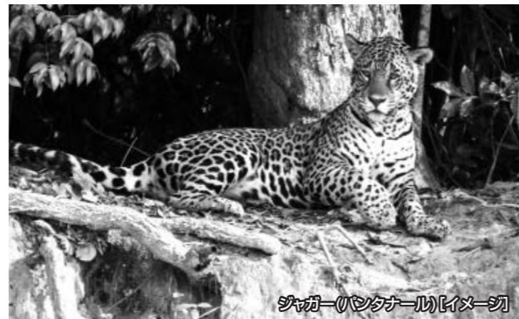
ジャガー(パンタナール)【イメージ】