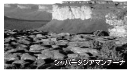
シャパーダ・ジアマンチーナ