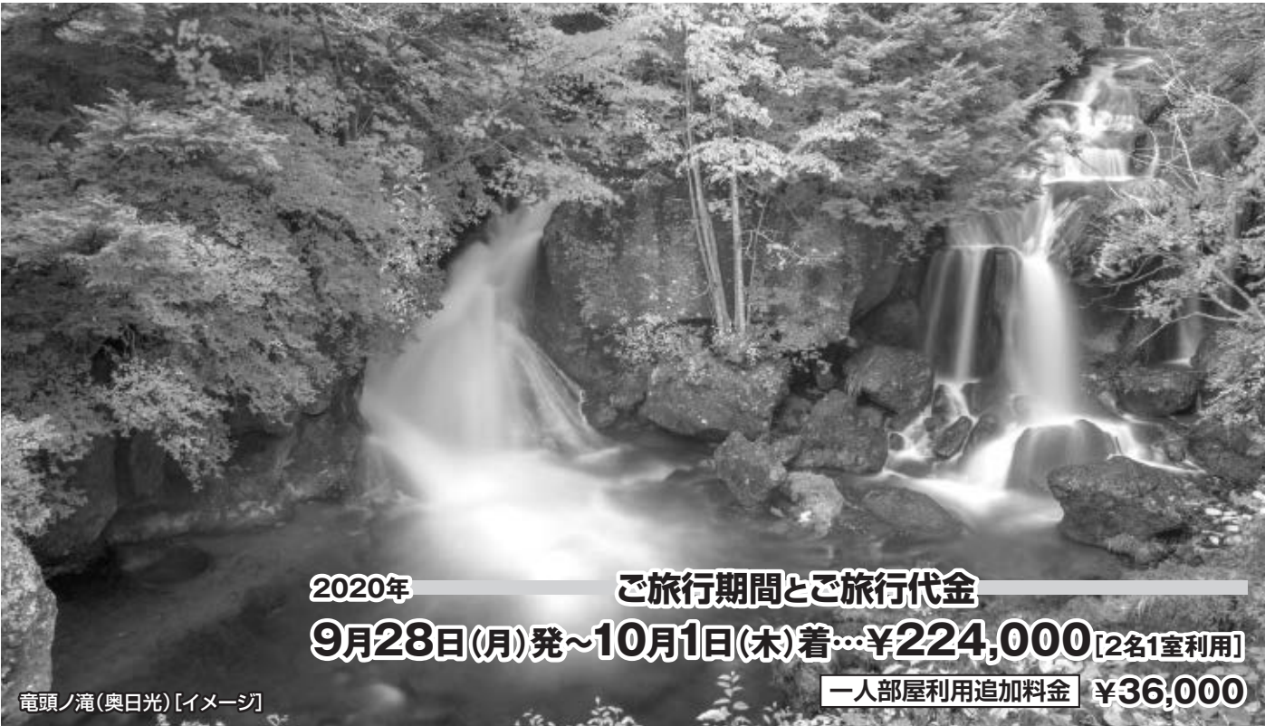
竜頭ノ滝(奥日光) [イメージ]

2020年 9月28日(月)発～10月1日(木)着… ¥224,000 [2名1室利用] 一人部屋利用追加料金 ¥36,000