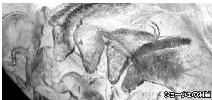
ショーヴェの洞窟