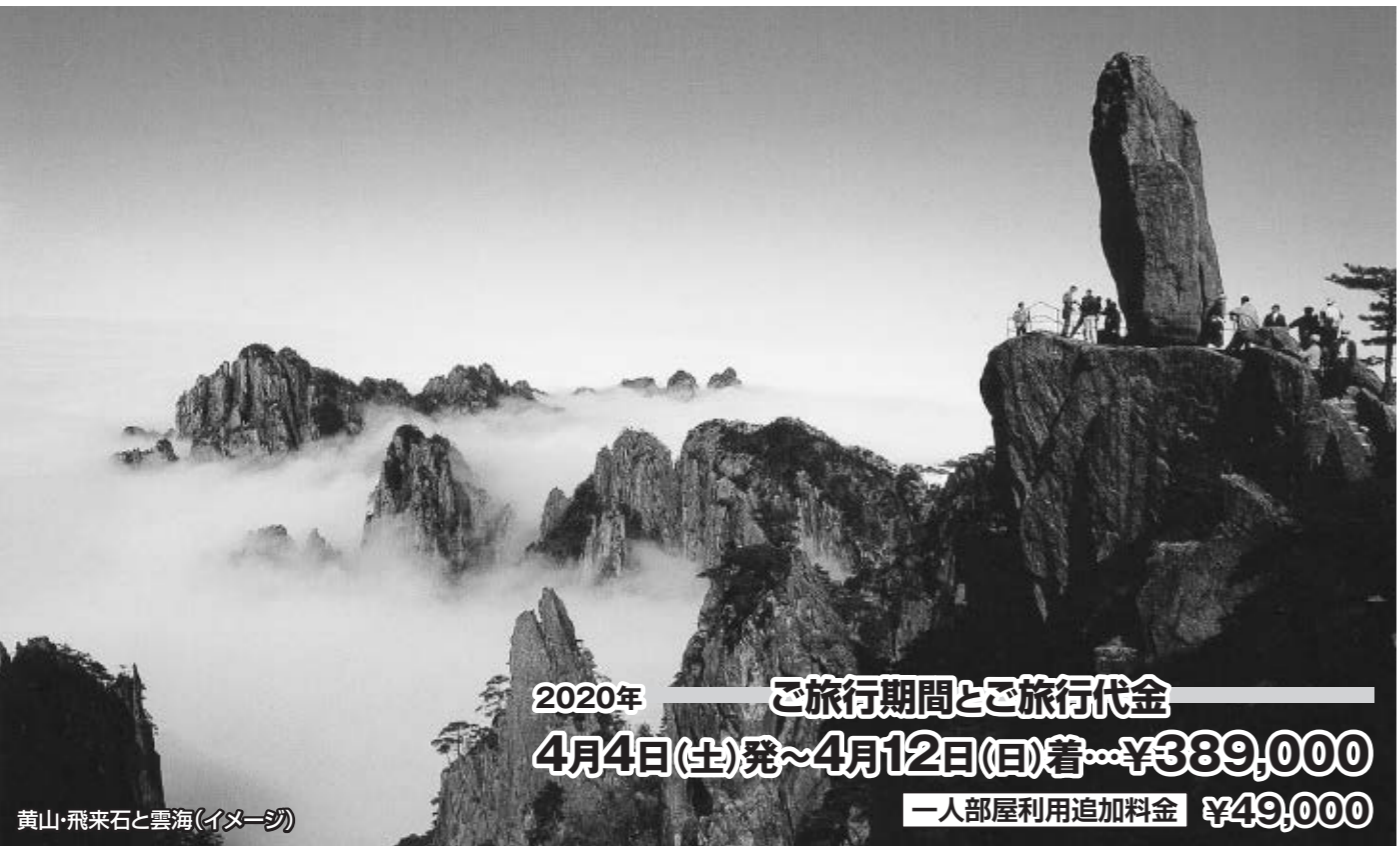
黄山・飛来石と雲海(イメージ)

2020年 ご旅行期間とご旅行代金 4月4日(生)発~4月12日(日)着...¥389,000 一人部屋利用追加料金 ¥49,000