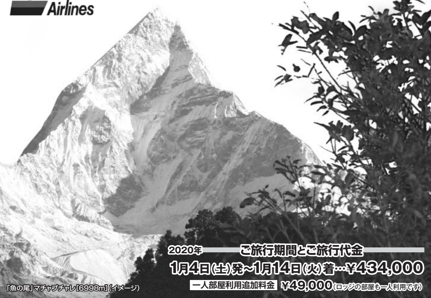
「魚の尾」マチャプチャレ[6993m](イメージ)

2020年 ご旅行期間とご旅行代金 1月4日(土)発~1月14日(火)着...¥434,000 一人部屋利用追加料金 ¥49,000(ロッジの部屋も一人利用です)