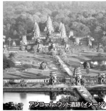
アンコール・ワット遺跡(イメージ)