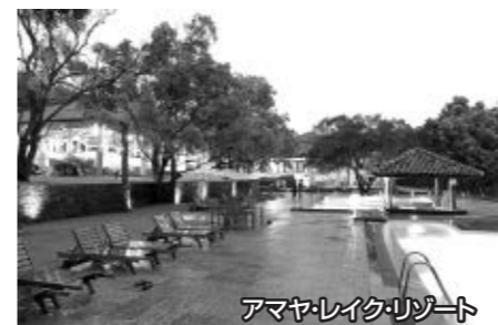
アマヤレイク・リゾート