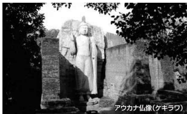
アウカナ仏像(ケキラワ)