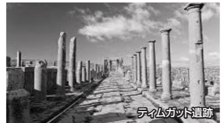
ティムガット遺跡