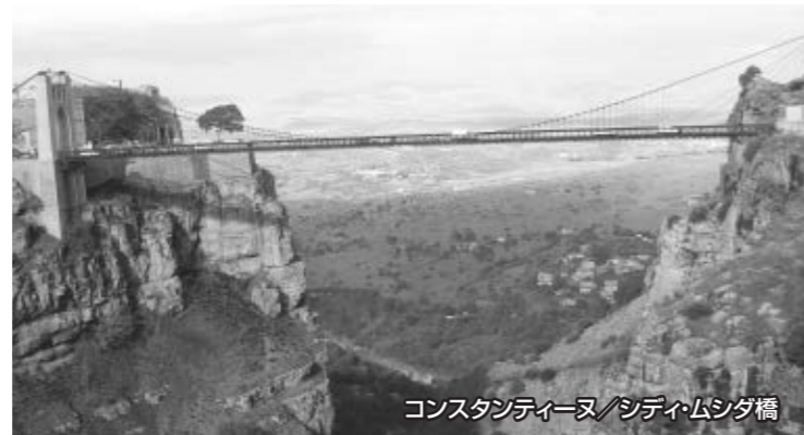
コンスタンティーン/シディムシダ橋

一つの村が飽和状態になると、隣の丘に別の村が造られました。こうして5つの村が建設され、さらに郊外にベリアーン、ゲラーラの2つの村が築かれました。各村は曲がりくねった 階段状の路地 が迷路のように 結ばれ要塞化 しています。アルジェリアの多くの都市が侵入者たちの影響を受けたのに対し、ムザブでは他からの干渉を受けない、伝統的なしきたりを守る厳格な生活が残されました。