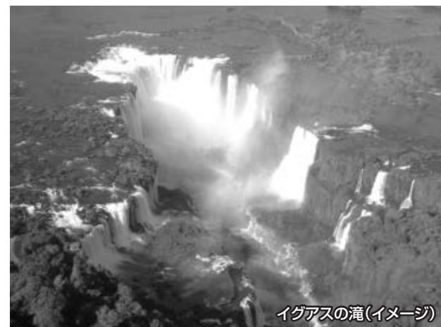
イグアスの滝(イメージ)

自然保護の目的で全体の5%しか解放されていない国立公園には、2000種類以上の植物、8種類以上の哺乳類、170種類以上の鳥類が生息しているため動植物の宝庫としても有名です。