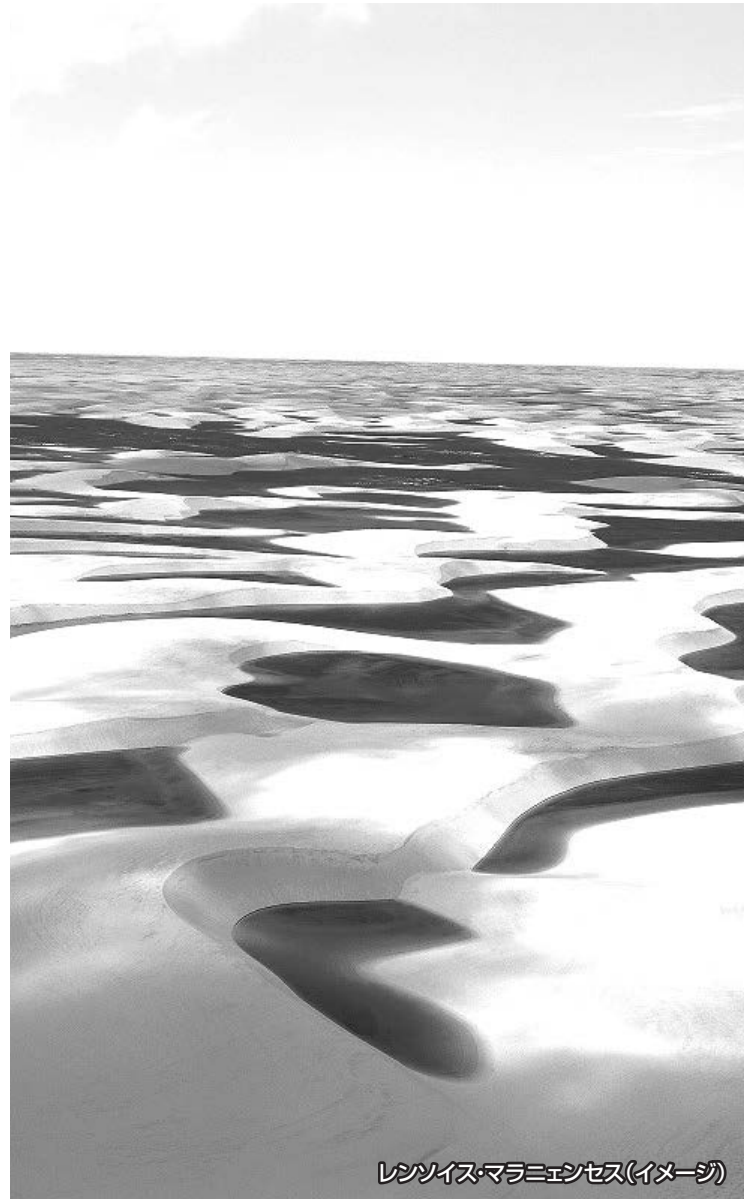
レンソイス・マラニェンセス(イメージ)