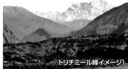
トリチミール峰イメージ