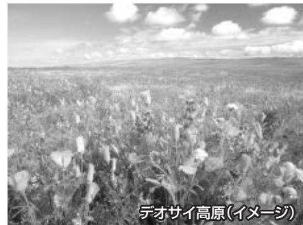
デオサイ高原(イメージ)