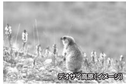
デオサイ高原(イメージ)

彼らが自ら名の「カラシュ(カラーシャ)」とはペルシャ語で「極度に貧しき者」、「持たざる者」の意味で、「カフィール」とは無信仰者を意味します。ペルシャ世界の人々から見れば、イスラムでも、ヒンドゥーでも、ゾロアスターでもない不思議な人々だったのです。チトラルはカフィールに由来し、別名をカフィリスタンとも呼ばれます。彼らの起源については何も確かなことは分かっていません。ある部族は紀元前327年にこの地に侵入し、ギリシャに帰らなかったアレキサンダー大王の軍隊の子孫だと主張していますし、ある部族はイスラムの到来以前にアラビアからやって来たと言い、またある部族はアフガニスタンからの移民であると主張しています。近年、ギリシャの団体が事務所を置き、2340年の時を越えた同じ民族の交流が始まっています。現在のカラシュ族はビリール、パンブレット、ランブールの3つの谷に約3,000人が20の村を形成しています。命ある動植物の全てや収穫に対する信仰を含めた多神教を信奉し、音楽と踊りを愛し、季節のお祭りごとに異なった踊りを楽しみます。