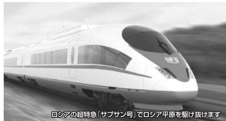
ロシアの超特急「サブサン号」でロシア平原を駆け抜けます