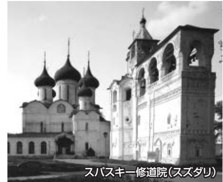
スバスキー修道院(スズダリ)

黄金の環は、モスクワを拠点として北西部に円を描くように点在する中世ロシアの古都群であり、その多くはヴォルガ河沿いに位置しています。12~18世紀にロシア正教の建造物が建てられ、かつての諸公国の首都や聖都として発展しました。日々近代化する現在のロシアとは対照的で、素朴な田園風景が広がっています。古き良き時代のロシアは、とても懐かしく、心に安らぎを与えてくれるかのようです。