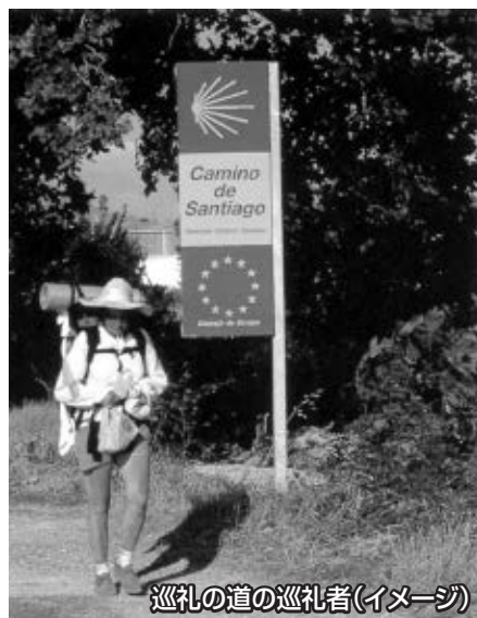
巡礼の道の巡礼者(イメージ)