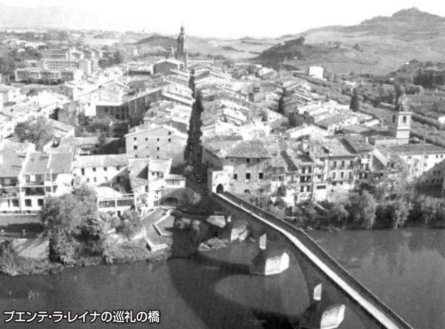
プエンテ・ラ・レイナの巡礼の橋