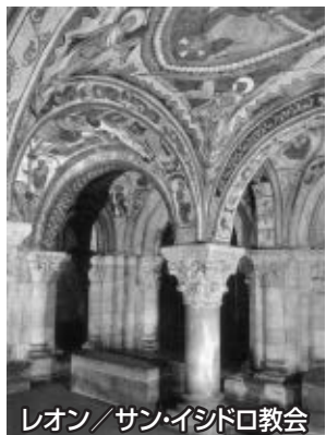
レオン/サン・イシドロ教会

この王家の豊廟でもある西側地下に残された見事なロマネスク様式の壁画は、低く限られたスペースの中に新約聖書の場面から、当時の 農村生活の様子 まで描かれています。今から約900年も前に描かれた壁画とは思えないほど保存状態が良く、まるで中世の時代にタイムスリップしたかのような錯覚に陥ります。