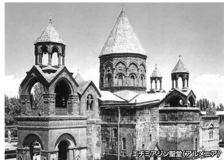
エチミアジン聖堂(アルメニア)

アルメニアの民族文化と教育の発展の歴史は、教会と密接に関係しています。聖堂は今も昔も世界のアルメニア人の結束のシンボルとなっています。