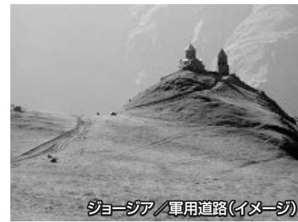
ジョージア / 軍用道路(イメージ)