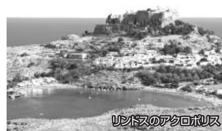
ロードスのアクロポリス

※右記の時間は、すべて現地時間で表示されております。※現地の都合によりスケジュールが変更される場合がございます。その場合でも極力日程に従って旅行サービスがお受けになれるよう万全の手配努力を致します。※表記の「機中泊」はそれぞれ「朝食・昼食・夕食・機内食」を示します。区印の食事は含まれておりません。