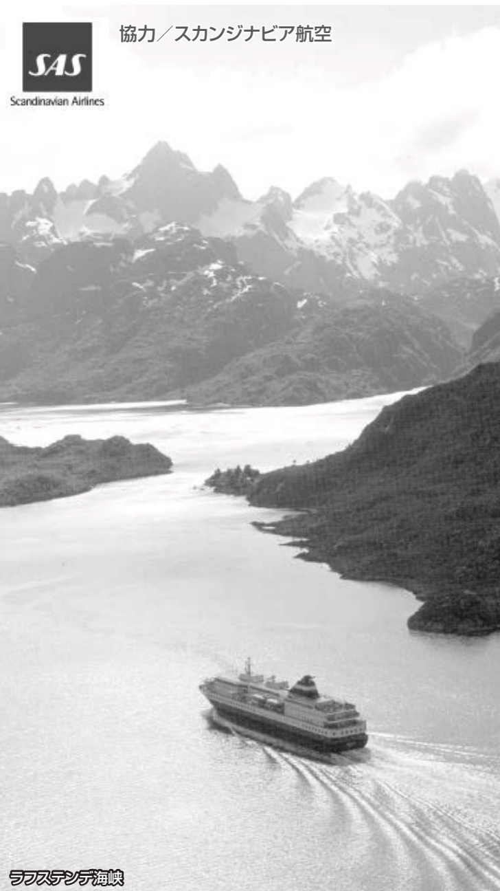
ラフステンデ海峡