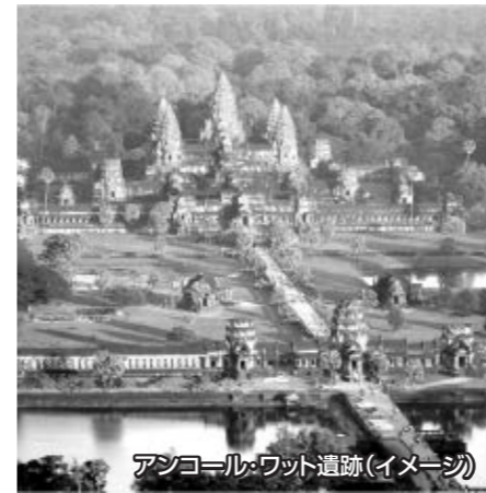
アンコール・ワット遺跡(イメージ)