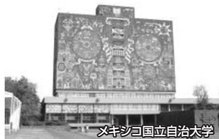
メキシコ国立自治大学

また、メキシコの伝統的な文化として、つばの広い帽子ソンブレロ、楽団マリアッチ、テキーラ等が挙げられます。これらメキシコの代名詞は、メキシコ国民がメキシコらしさとして挙げるものであって、これらなくしてメキシコは無い、というほど深く愛されてきたものです。実際2000年以上の歴史を持つテキーラは、日本でいう焼酎のような地位にあります。国内では手頃なビールもよく飲まれています。瓶ビールが多いメキシコでは、瓶の口の部分にライムを絞り、塩を振りかけてライムを瓶の中に落としてから飲みます。このメキシコ式の飲み方は、一段と爽やかさが増す美味しい飲み方で地方によって気質の違いは様々のはずですが、楽しい席では誰もが友達(アミーゴ!)となり、ビールやテキーラを片手に乾杯(サルー!)をします。その場に居合わせた誰もがその暖かな雰囲気飲み込まれてしまうのは、メキシコの空気がそうさせるのか、知らぬ間に彼らのエネルギーが伝染しているのか、我に返って来た時に彼らのエンターテイナーとしての特異な素質に大変感心させられます。