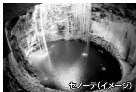
セノーテ(イメージ)