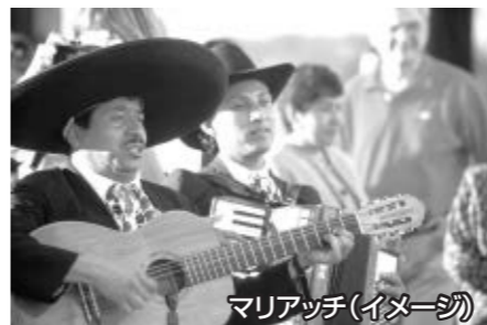
マリアッチ(イメージ)