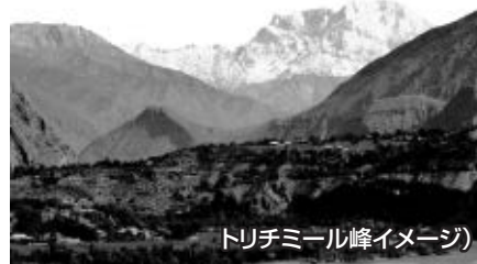
トリチミール峰イメージ