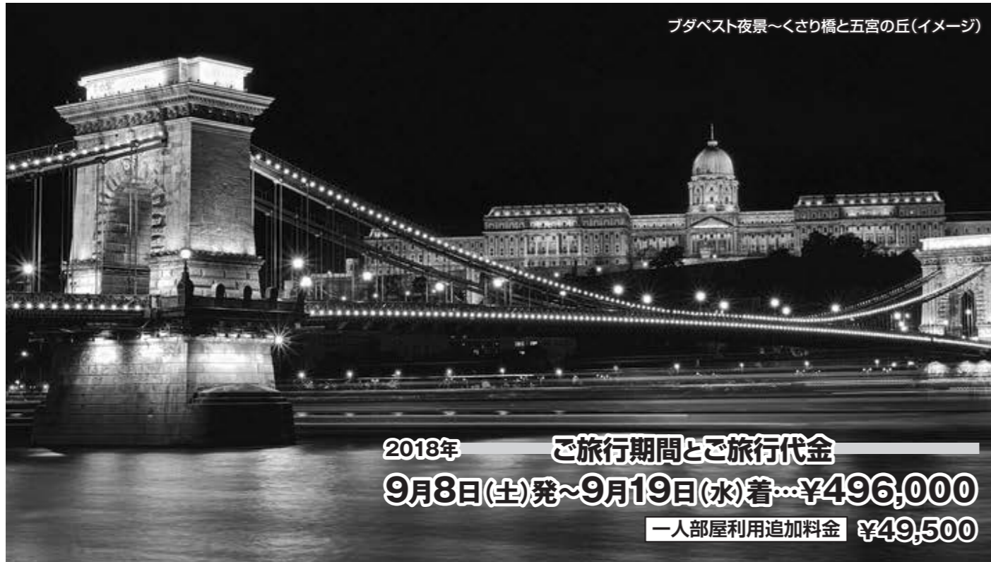
ブダペスト夜景〜くさり橋と五宮の丘(イメージ)

2018年 ご旅行期間とご旅行代金 9月8日(土)発~9月19日(水)着...¥496,000 一人部屋利用追加料金 ¥49,500