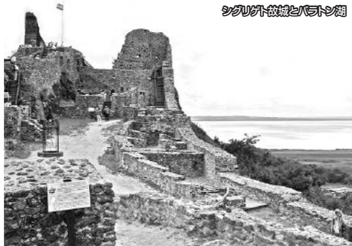
シグリゲト故城とバラトン湖