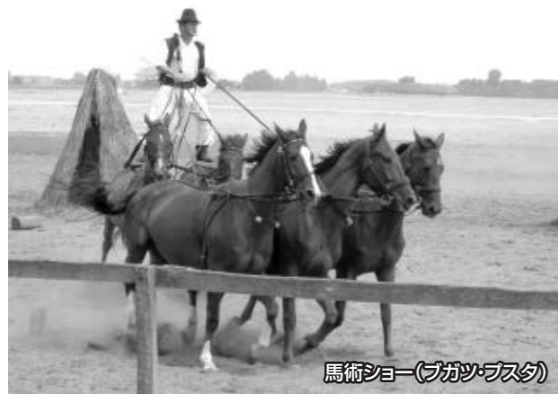
馬術ショー(ブガツ・ブスタ)