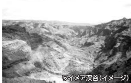
ワイメア渓谷(イメージ)