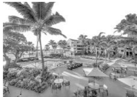
コートヤード・マリOTT・カウアイ・ココナッツビーチ

※右記の時間は、すべて現地時間で表示されております。※現地の都合によりスケジュールが変更される場合がございます。その場合でも極力日程に従って旅行サービスがお受けになれるよう万全の手配努力を致します。※表記の「☑」はそれぞれ「朝食・昼食・夕食・機内食」を示します。☒印の食事は含まれておりません。※一部ツアーは混載観光となる場合もございますので、ご了承ください。