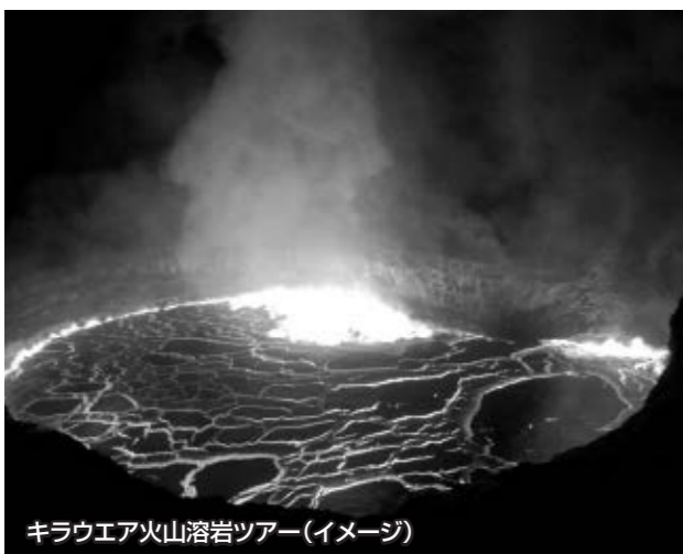
キラウエア火山溶岩ツアー(イメージ)