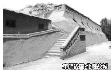
車師後国・北庭故城