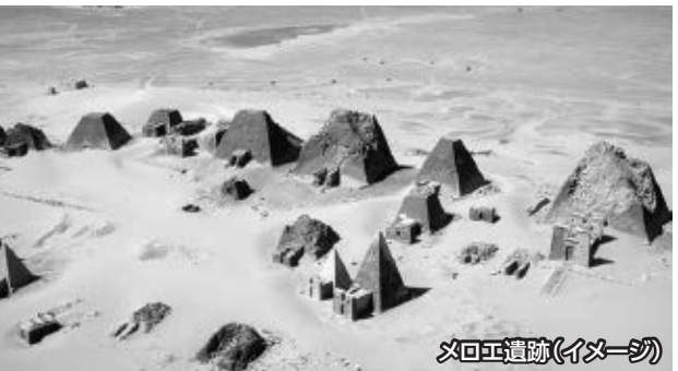
メロエ遺跡(イメージ)