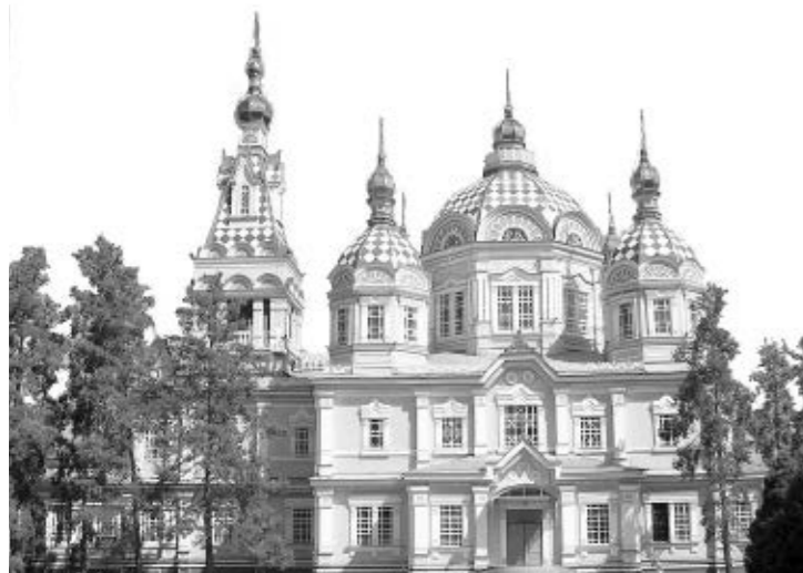
ゼンコフ正教会(アルマトゥ)