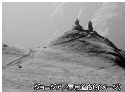
ジョージア / 軍用道路(イメージ)