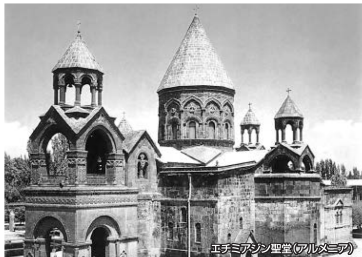
エチミアジン聖堂(アルメニア)

アルメニアの民族文化と教育の発展の歴史は、教会と密接に関係しています。聖堂は今も昔も世界のアルメニア人の結束のシンボルとなっています。