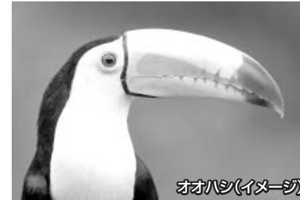
オオハシ(イメージ)

サンホセ8月平均気温 最高気温25.2℃/最低気温16.7℃ ※年間を通じて、スコールがあります。