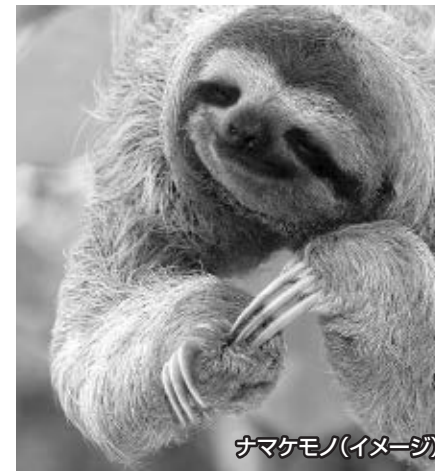
ナマケモノ(イメージ)