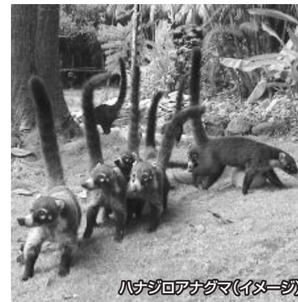
ハナジロアナグマ(イメージ)