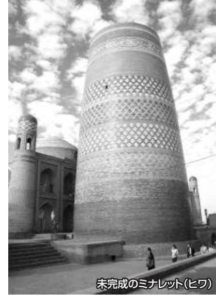
未完成のミナレット(ヒワ)

全長2200メートルの城壁に囲まれたヒワの町は、かつて『太陽の国』ホラズム国の都として繁栄しました。旧市街は、外敵の侵入を防ぐ2重の城壁で守られていて、イチャン・カラと呼ばれる内城には、今も当時を偲ばせる建物が昔のままに残っています。全体が土色の煉瓦で造られた町に、青いタイルで飾られた未完成の塔「カルタ・ミナール」が映えるヒワの町は、町全体がまるで歴史博物館のようで、ユネスコの世界遺産に登録されています。イチャン・カラに一歩足を踏み入ると、隊商時代のオアシス都市にタイムスリップしてきたかのようです。古宮殿クフナ・アルクの展望台から眺める町並みも是非お楽しみください。