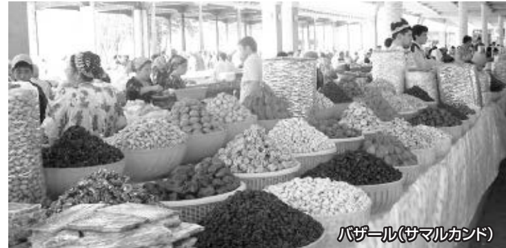
バザール(サマルカンド)

ソグド商人がシルクロードで活躍したソグディアナの中心地・古代サマルカンドは、『光輝く地』と謳われ、紀元前4世紀に訪れたアレキサンダー大王がその美しさで驚嘆した町でしたが、12世紀のモンゴルの侵入により完全に破壊し尽くされました(現アフラシャブの丘)。この地を以前よりも増して美しい都に再建したのが14世紀のティムールです。大帝に相応しい世界一の首都にするため、イスラム世界やシルクロードの各地から、建築家や芸術家を集め、『イスラム世界の宝石』と呼ばれる美しい都を築いたのです。その特徴は『サマルカンドブルー』と呼ばれる美しい青タイルの建築群で、その素晴らしさは、15世紀の詩人に『もし空が真似をしなかったなら、他に比べるべきものはない』と詠まれました。