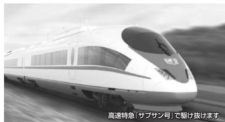
高速特急「サブサン号」で駆け抜けます