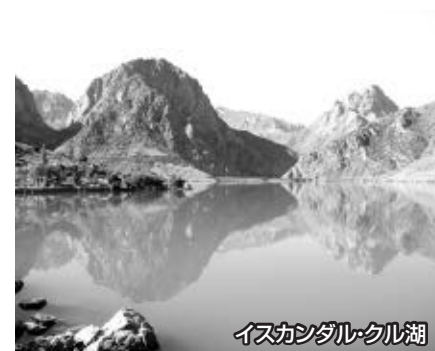
イस्कンダル・クル湖