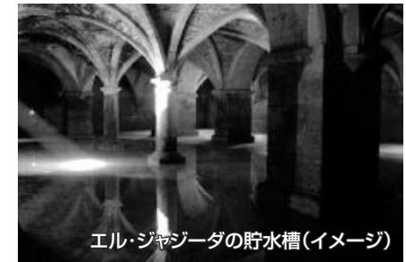
エル・ジャジータの貯水槽(イメージ)

後にマサガンはイスラム風にエル・ジャジータ(新しいものの意)と改称され、現在に至っています。ポルトガル人は200年に及ぶモロッコ人からの攻撃に持ちこたえるため、非常用として穀物庫を貯水槽として利用しました。それらが今世紀に発見され、薄暗いゴシック様式の建物内には水が張られ、一層神秘的な雰囲気を演出しています。