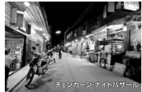
チェンカーン・ナイトバザール

日が暮れ始めるとノスタルジックな雰囲気が漂うウォーキング・ストリートが賑わいを見せます。伝統的なタイ式家屋を利用したゲストハウスやカフェ、レストランに食べ物の屋台。おしゃれな小物やTシャツ、アクセサリーのお店など、街歩きをしながらお土産物探しや地元の人々との触れ合いも楽しめます。※パーイ:タイ北部の美しい村