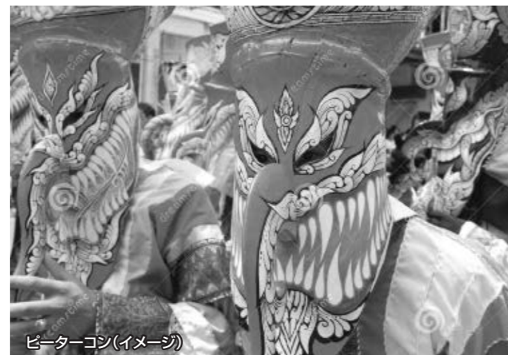
ピーターコン(イメージ)