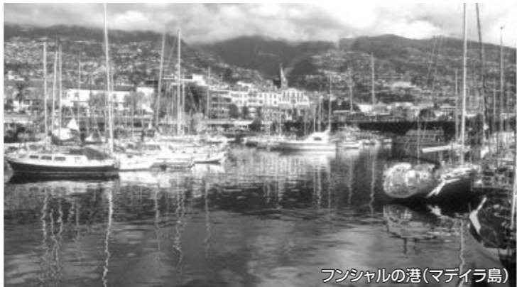
フンシャルの港(マデイラ島)

ポルトガルの首都・リスボンから南西に約1,000km、大西洋に浮かぶマデイラ島。1418年にポルトガルの探検家によって発見されるまでは、無人島でした。発見時、島は深い森林に覆われていたことから、樹を意味するマデイラと名付けられました。現在ではポルトガル領となっていますが、地理的には北アフリカのモロッコにより近く、独自の議会・政府を持つ自治領です。年間平均気温が19℃と冬を知らない穏やかな亜熱帯性の気候で晴天率も高く、いつも太陽の光につつまれているこの島は、「 大西洋の真珠 」、「 花の島 」などと呼ばれ、ヨーロッパ屈指のリゾート地です。海のリゾートというイメージが強いマデイラ島ですが、対照的な魅力として「山」があり、数え切れない種類の植物が生い茂り、島の中央部の山岳地帯には 世界自然遺産 にも指定される太古の姿をとどめる 照葉樹林 が広がっています。豊かな自然、青い海と輝く太陽、島中に年中絶えることのないカラフルな花やフルーツなど、ポルトガル本土とは異なる南国情緒が溢れる マデイラ島 に3泊いたします。島の中心・フンシャルはもちろん、 マデイラ島の雄大な自然 をたっぷりご案内いたします。 名物トボガンの坂下り、世界遺産の照葉樹林の原生林ウォーキング など、マデイラ島ならではの観光もお楽しみください。「大西洋の真珠」マデイラ島へぜひお出掛けください。