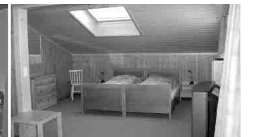
No.4 距離:7分 1.5室(ベッド2台、追加1台可)。60㎡ バルコニーあり。TV, PC 電子レンジ。2階利用 [大家] 内装が綺麗。天窓から星が楽しめる。 バルコニーからアイガー北壁の眺めが良い。