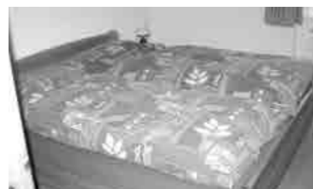
No.5 距離:5分 3室(ベッド4台)。65㎡ TV 電子レンジ。洗濯機。 テラスが広い。