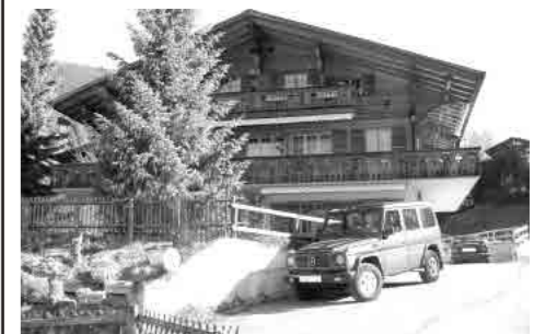
No.1 距離:10分 2室(ベッド2台)。45㎡ TV, TEL, PC 高台にある。間からアイガー北壁が一望。