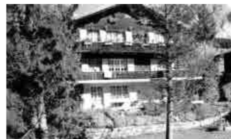
No.2 距離:10分 3室(一部屋は1ツイン、もう一部屋は二段ベッド)。 TV, PC 洗濯機。[大家] 75㎡ 内装が新しい。喫煙可。