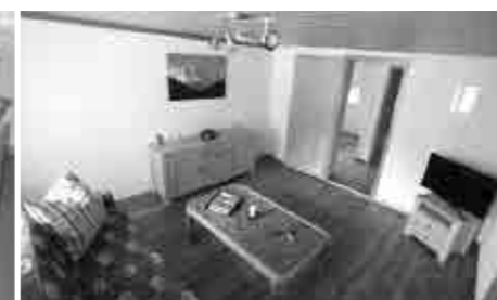
No.6 距離:15分 2室(ベッド2台)。45㎡ TV, PC 電子レンジ。食器洗い機。洗濯機。 [大家(英語は片言)] アイガーだけでなく氷河や ヴェッターホルンも近くに見えます。喫煙可。