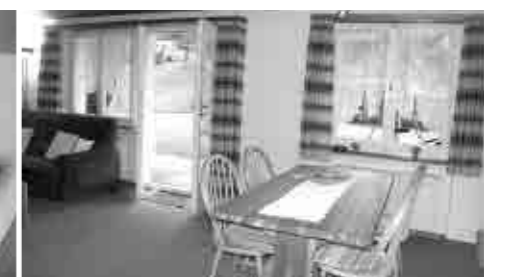
No.7 距離:15分 2室(ベッド2台)。60㎡ TV, PC 洗濯機 [大家] 広いリビング。テラスからアイガーが迫力満点。