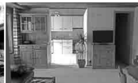
No.3 距離:3分 2室(ベッド2台[追加1台可])。 バルコニーあり。TV, TEL, PC 洗濯機の利用は滞在中一回。[大家] 45㎡ テラスからアイガーの眺めが素晴らしい。