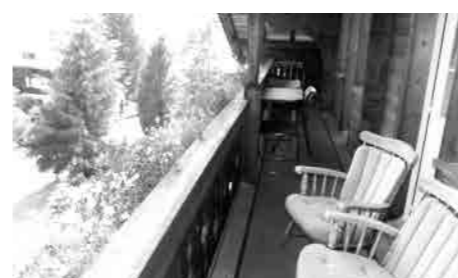
No.8 距離:15分 3室(4ベッド) 2階利用 65㎡ バルコニーあり TV, PC, TEL 洗濯機、電子レンジ [大家] Wi-fiあり バルコニーからアイガー北壁が眺められる