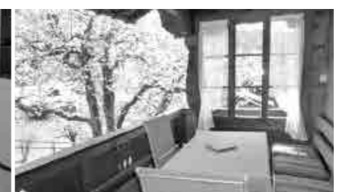
No.10 距離:6分 3室(1ツイン、1シングル)。70㎡ バルコニーあり。TV 電子レンジ。洗濯機。 [大家(英語は片言)]