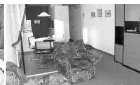
No.9 距離:15分 2室(ベッド2台)。バルコニーあり。 TV, PC 電子レンジ。洗濯機。ワイヤレスLAN。45㎡ バルコニーからアイガーが見える。 パン屋さんや教会に近い。