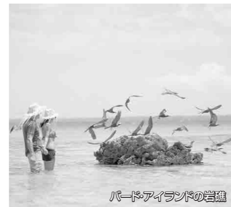
バード・アイランドの岩礁