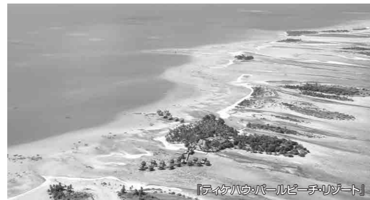
『ティケハウ・パールビーチ・リゾート』

ヤシの原生林とピンクの砂のビーチに囲まれた『ティケハウ・パールビーチ・リゾート』のタヒチの伝統的ポリネシア様式で建てられた広々としたバンガローは、100%島の天然素材を利用して造られています。そのままの自然がうまく調和され落ち着いた雰囲気漂います。全37棟の隠れ家での優雅なひとときとポリネシア流のおもてなしを、どうぞ『ティケハウ・パールビーチ・リゾート』にてご堪能ください。