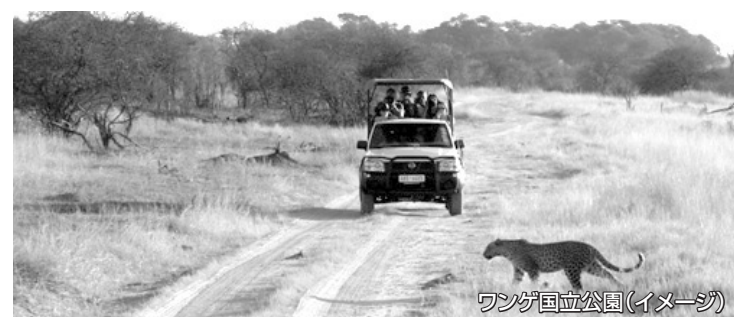
ワング国立公園(イメージ)