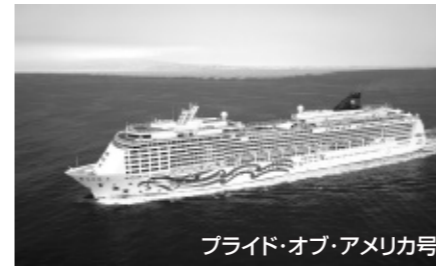
プライド・オブ・アメリカ号