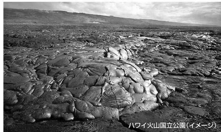
ハワイ火山国立公園(イメージ)