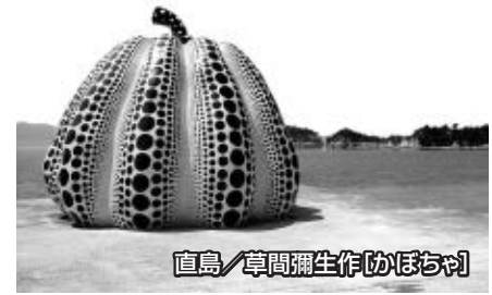
直島/草間彌生作「カボチャ」

「島全体がアート」と言われる直島は、地中海美術館や草間彌生の「カボチャ」をはじめとした様々なアート作品に触れ合うことができます。本村地区では、株式会社ベネッセの福武總一郎氏の考案のもと、「家プロジェクト」と呼ばれる、古民家を改装し、現代芸術家が家そのものを作品化した7つの建築物からなるプロジェクトが展開されています。このプロジェクトには、建築家の安藤忠雄氏、美術家の宮島達男氏、彫刻家の内藤礼氏、写真家の杉本博司氏、現代美術家のジェームズ・タレル氏が参加しています。